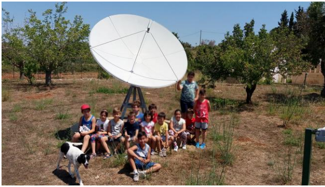
Il radiotelescopio da 3,4 metri di diametro