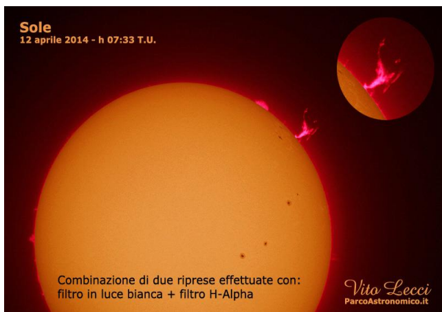
Una foto del sole realizzata dal Parco Sidereus

Durante le visite serali invece ci si potrà cimentare nell'osservazione della corrugata superficie della Luna (crateri, mari e catene montuose), dei pianeti (Saturno, Giove, Marte, ecc...), di nebulose, galassie e tutto ciò che il cielo proporrà in occasione della serata scelta.