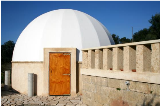
La cupola in muratura da 6 metri di diametro ospita un planetario a doppia tecnologia analogica + digitale 3D