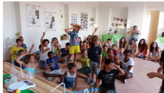
Una capiente Sala Didattica dedicata a relazioni, conferenze, corsi, attività laboratoriali, ecc...