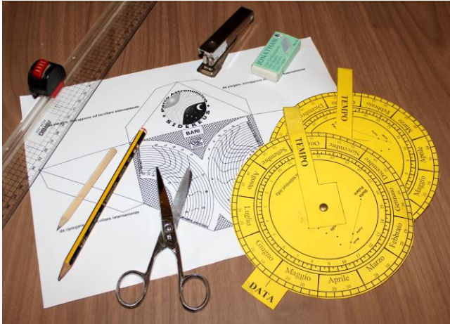
Piccoli strumenti da realizzare con materiale povero

Scoprire lo scopo e la funzione di ogni singolo componente di un razzo, prevederne la sua accelerazione, la velocità, l'apogeo prima e durante un lancio è entusiasmante.