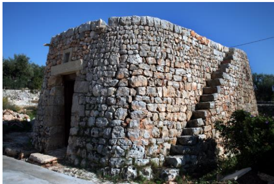
Liama in pietra a secco, risalente a metà '800, ospita un piccolo Museo dell'Astronautica , con materiale filatelico volato nello spazio