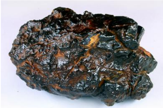
Una delle nostre meteoriti