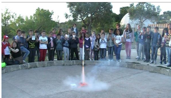
Due aie da 6 e 8 metri da destinare ad attività sperimentali all'aperto, rampe di lancio per i razzi, ecc...