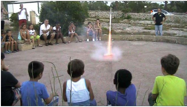
Lancio di un razzo da una delle nostre rampe