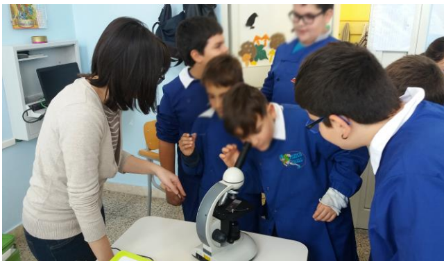
Gli studenti osservano al microscopio. Attività realizzabile anche presso la vostra scuola.