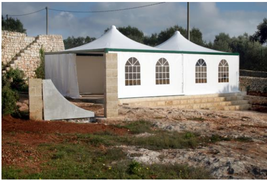
Galleria delle Scienze allestita nel gazebo, da 50 m 2 , con una esposizione di modellini, astrofotografie, meteoriti, meridiane, ecc...