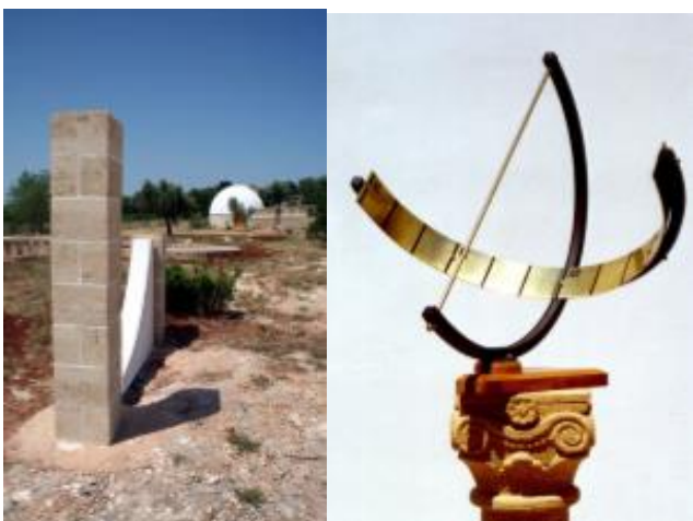
Alcuni dei quadranti solari al Parco Sidereus

permetteranno di comprendere a fondo il funzionamento del sistema di riferimento orario attualmente in uso e degli "errori" che sono stati volutamente introdotti ai soli fini di ordine pratico.