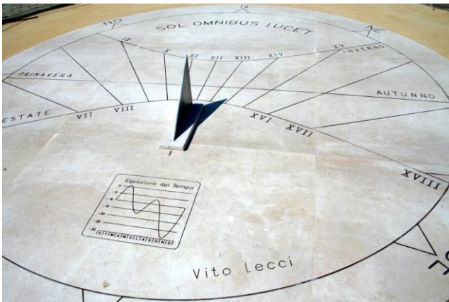
Quadrante solare da 4 metri di diametro (a Salve)