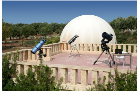
Terrazzo delle Stelle , una superficie di 80 m 2 , allestita con diversi telescopi attraverso i quali osservare il cielo