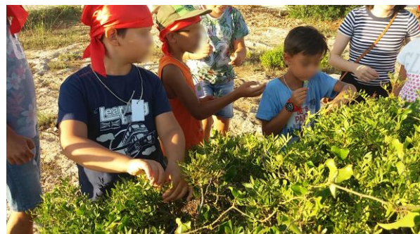
Tutto il resto del Parco per le attività correlate alla biologia, alla botanica ed alla biodiversità della nostra flora.