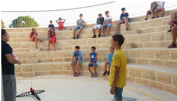
Un grande Anfiteatro in cui ritrovarsi per tutte le più belle attività da svolgersi all'aperto